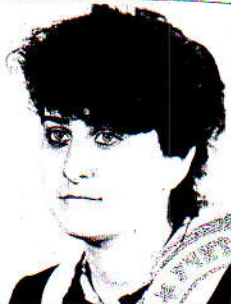
счат без герб